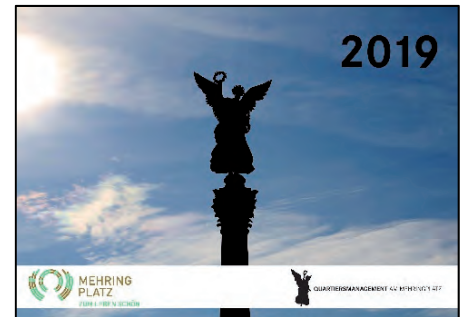
Kalender 2019

Dieser liegt am Tag der offenen Tür kostenlos für Sie in unserem Büro bereit und wird – solange der Vorrat reicht – an die Nachbarschaft ausgegeben.